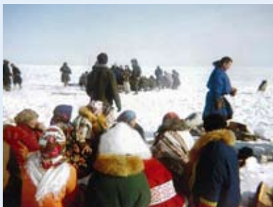
Общий обряд жертвоприношения на озере Нум-то