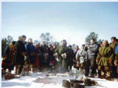
Общий обряд жертвоприношения на озере Нум-то возле Святого острова

Традиционная хозяйственная деятельность лесных ненцев, проживающих на территории парка, представлена частным оленеводством, рыболовством, охотничьим промыслом, сбором дикоросов. Круглогодично большинство семей проживает в отдельных стойбищах, создав