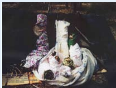
На этом сооружении, имитирующем «священную нарту», хранятся изображения духов (кахе/кахе) Шуки, Солнца-Луны, Шаманского камня и «Охотничьей удачи» (здесь – голова и лапка выдры) а также пояс прежнего главы семьи