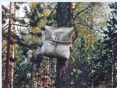
Берестяной короб с последом