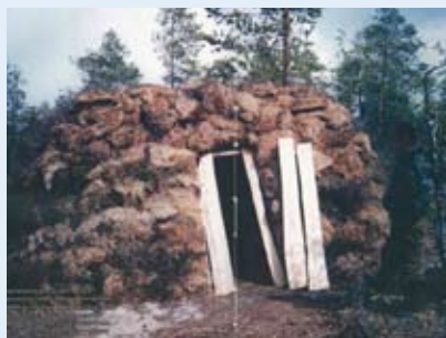
Встречающиеся у лесных ненцев современные хозяйственные постройки из дерна (кум) сохраняют в целом внешнее сходство с традиционными северо-селькупскими полуземлянками, использованными в качестве жилищ