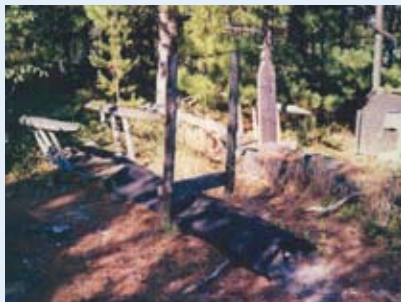
В похоронно-погребальном комплексе пян хасова отсутствует унификация черт, характерная для погребальных

Семейно-родовые святилища связаны с верой в духов-покровителей рода или семьи. Сакральную атрибутику хранят внутри дома; в священной нарте на задней стороне дома. Священную семейную (родовую) атрибутику держат в глухом лесу, вдали от посторонних глаз в лабазах на деревянных сваях. Изображениям духов-покровителей подносили пожертвования по разным случаям: после рождения ребенка, чтобы обеспечить ему здоровье и благополучие, для благополучия семьи, сохранения оленей и т.п. Пожертвования в зависимости от случая и обряда могли быть в виде платков, полотен разноцветных тканей с завязанными в уголках монетками, специально сшитая одежда боже-ству, черепа жертвенных животных и др.