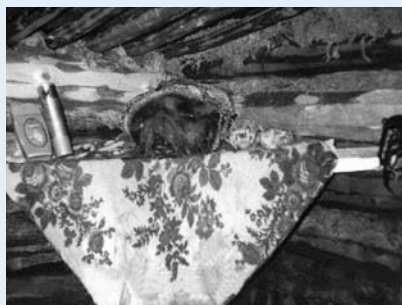
Голова Медведя, одно из сыновей верховного божества ненцев Нума, аналогично православным иконам, размещается только в «чистом» углу дома

Главный дух – хранитель реки Казым, верховная богиня-покровительница казымских ханты и лесных ненцев. Казымская богиня занимает важнейшее место в пантеоне божеств и в их мировоззрении. Богиню почитают все народы Севера. О ней сложено множество легенд. Она определяет жизненный путь человека, в ее власти вымолить прощение и прийти на помощь. Священное место – место пребывания Казымской богини – верховье реки Казым.