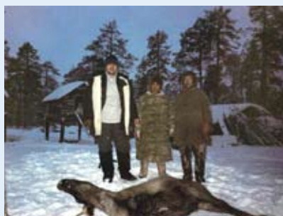
Домашний обряд жертвоприношения

крестьянско-фермерские хозяйства по разведению оленей, одна семья создала семейную оленеводческую бригаду от унитарного предприятия «Оленеводческий совхоз Казымский». Минимально необходимые объекты социальной инфраструктуры (магазин, фельдшерский пункт, клуб, почта) находятся в д. Нумто, расположенной на юго-западном берегу озера Нум-то.