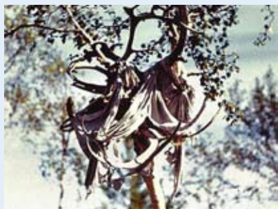
Жертвоприношение (дары богам)