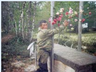
Наземное захоронение в районе озера Нум-то