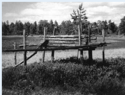
Традиционная ловушка давящего типа (слопец) на песка и лису (район озера Нум-то)

Угроза потери исконной среды обитания, традиционного образа жизни и промысла, духовной и материальной культуры обоснованно воспринимается коренными жителями как угроза потери своего этноса. Однако в современных условиях отсутствие объектов жизнео-