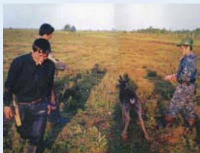
Забой оленей до сих пор начинается с традиционного удушения